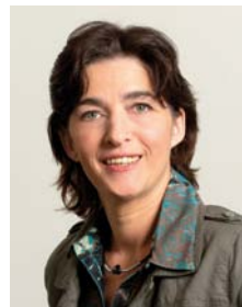
Zu Gast auf dem Kongress: NRW-Gesundheitsministerin Barbara Steffens