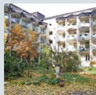
St. Josefinenstift Ostwall 8-10, 44135 Dortmund Tel. (0231) 55 69 05-0