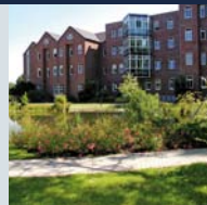
St.-Elisabeth-Altenpflege Kurler Straße 130, 44319 Dortmund Tel. (0231) 2892-0