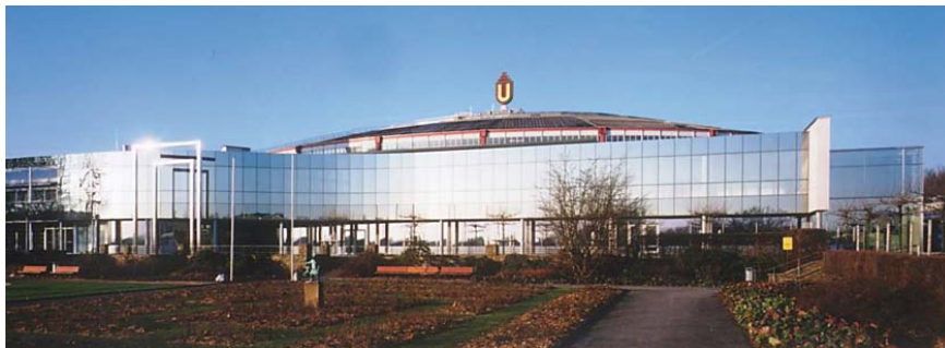
Kongresszentrum Westfalenhallen Dortmund