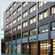
Ambulantes OP-Zentrum Johannesstraße 9-17, 44137 Dortmund Tel. (0231) 1843-2130